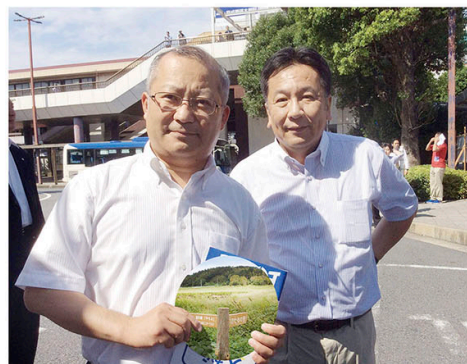
枝野代表と共にボトムアップの政治を目指します！