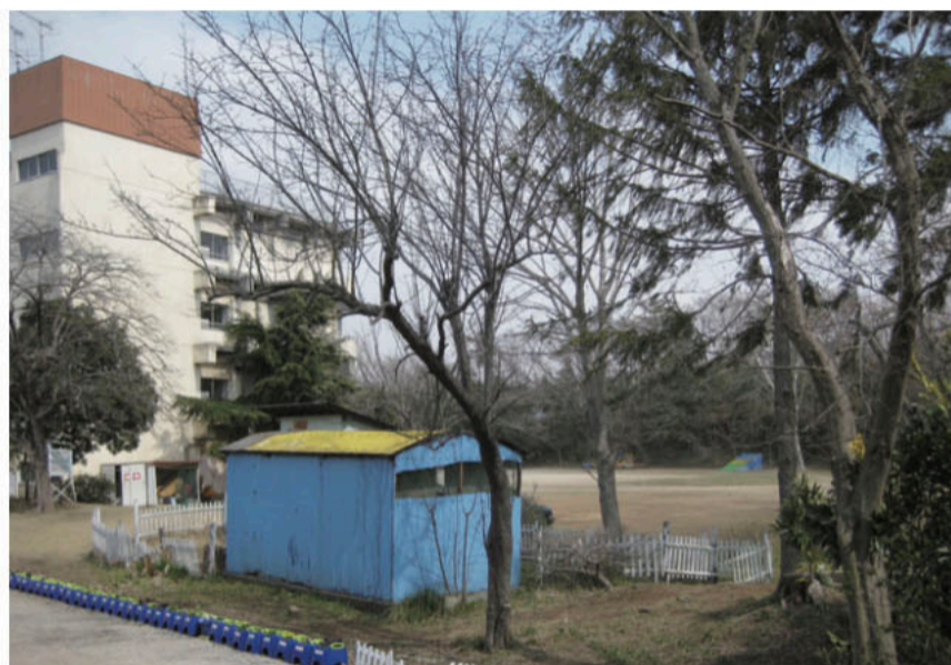
現在、解体工事が行われている旧八千代台東二小。令和3年度には、市民が集える防災機能を備えた広場の建設が開始予定！

これらの提案が実り、市の福祉的役割で連携する形で、 とくし丸 の移動スーパー「とくし丸」が現在八千代台や大和田・萱田地域などで展開されています。今後、市内の他地域においてもこのように民間企業と連携・展開できるように行政に働きかけ、買い物・交通弱者対策のさらなる充実を図っていきます。