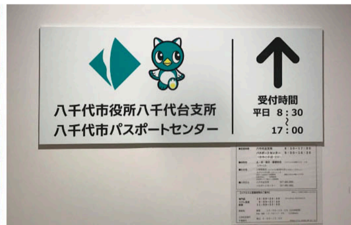
電車やバスなどのアクセスも良い八千代台駅前の、ユアエルムの中にパスポートセンターが併設された新しい八千代台支所がオープン！